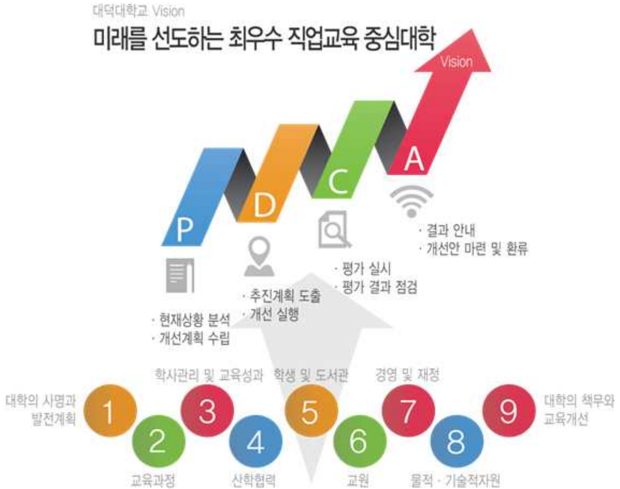
[그림 1-1] 대학 자체평가 목적