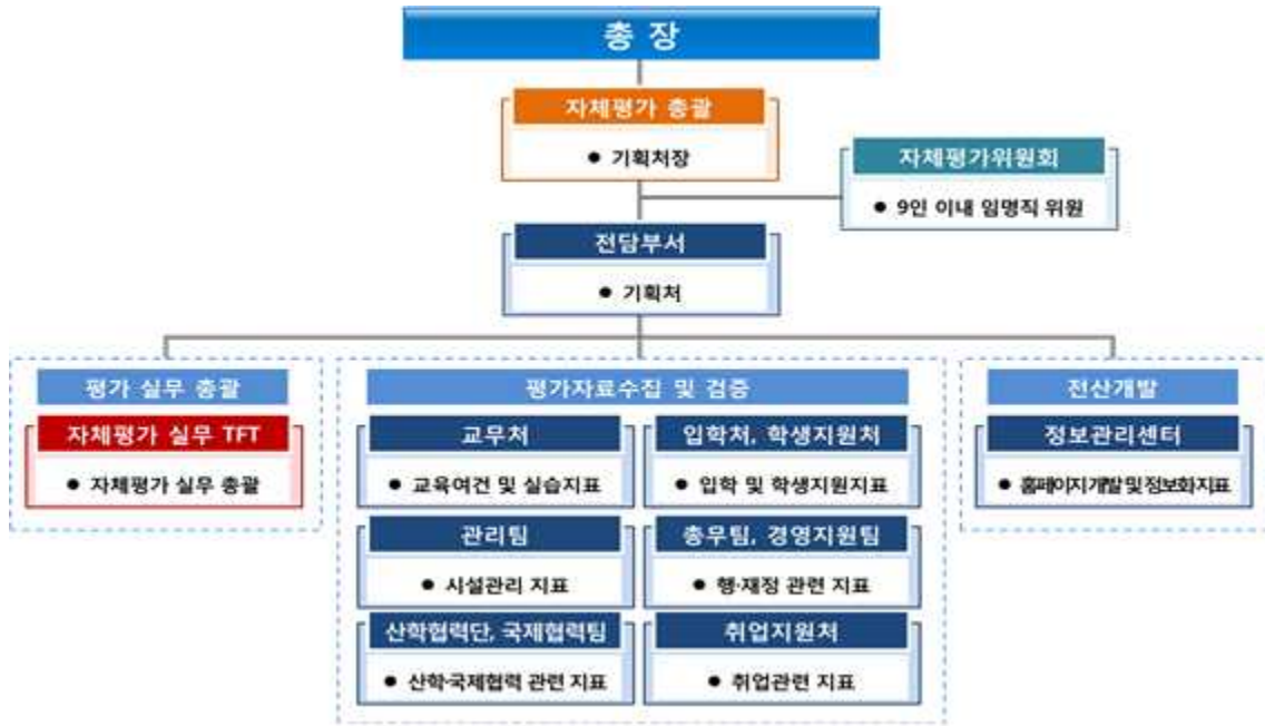
[그림 1-2] 대학 자체평가 목적